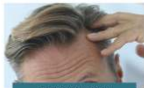
DIRECT HAIR FUSION

48 Years | 65 Clinics | 250,000 Delighted Clients | 150 Procedures Everyday