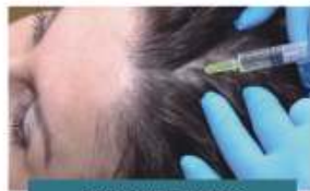
PRP GROWTH FACTORS